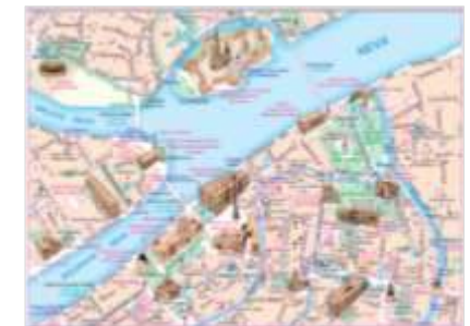
Реклама в отрывных картах «Центр Санкт-Петербурга»