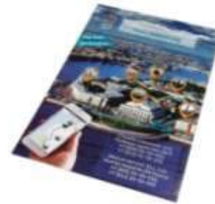
Флаер А6 105*148