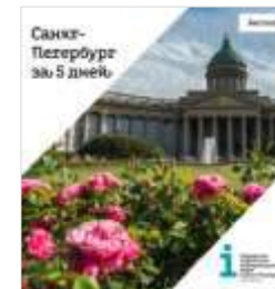
Реклама в брошюре «Санкт-Петербург за 5 дней»