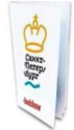
Евроброшюра (до 10 листов)